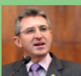
Heitor Schuch (PSB-RS)